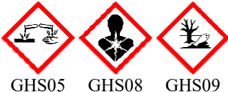
GHS05 GHS08 GHS09